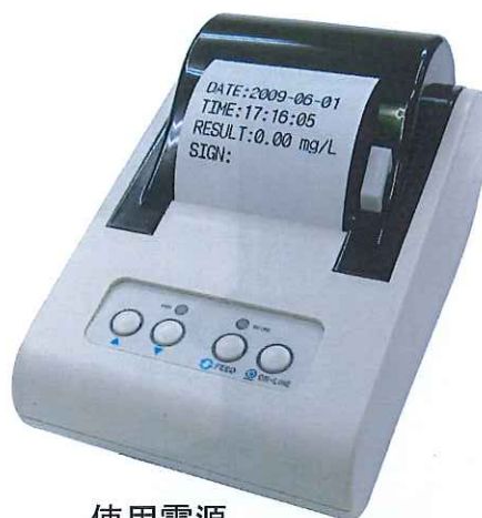
使用電源 一般家庭用電源(100V) 商品サイズH270×W240×D120mm

付属品 商品本体・プリンター・フィルターユニット ロール紙・ACアダプター・説明書・保証書