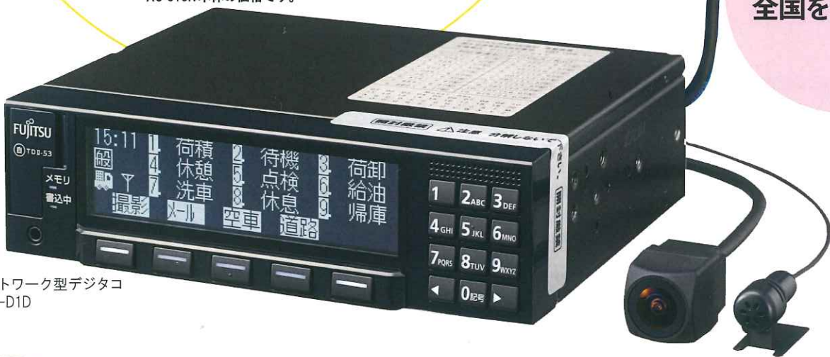
ネットワーク型デジタコ DTS-D1D