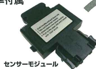
センサーモジュール

ドライバーはスタートボタンを押して吹くだけ センサーモジュールは脱着式で現場交換可能 デジタコ接続用ケーブル標準付属