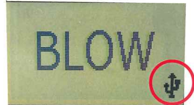
接続中右下にコミュニケーションマーク点灯